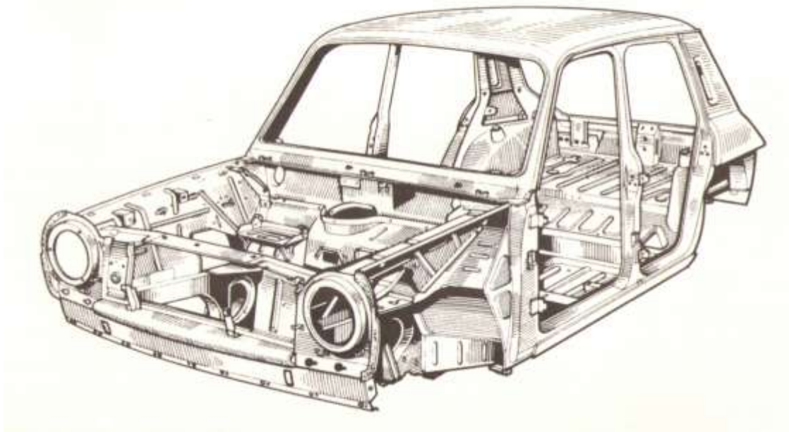
Abb. 4: Rohkarosserie