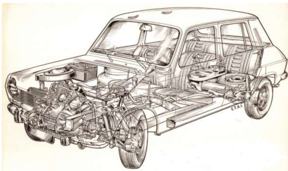
Abb. 2: Simca 1100 Röntgenblick