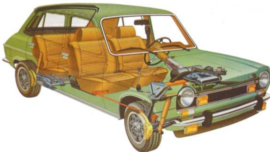
Abb. 1: Simca 1100 Röntgenblick